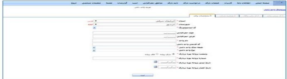
اطلاعات مربوط به واحد های ثبت شده در بخش جستجوی واحد قابل مشاهده می باشد.

مربوط به شهرستان مورد نظر نمایش خواهد یافت. در صورتی که کد اپیدمیولوژیک واحد مورد نظر را انتخاب نمایید طول و عرض جغرافیایی و نوع فعالیت واحد مربوط به آن نمایش خواهد یافت. برای واحد هایی که کد اپیدمیولوژیک روستایی دارند، می توان از یک کد اپیدمیولوژیک برای ثبت چند واحد استفاده نمود. پس از بررسی اطلاعات مورد نظر و انتخاب گزینه ثبت اطلاعات مورد نظر برای سامانه پنجره واحد کشاورزی ارسال و شناسه یکتایی برای واحد مورد نظر ثبت خواهد گردید.